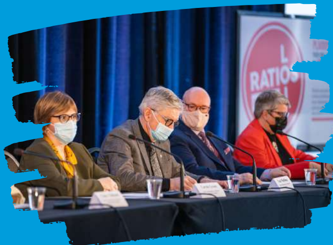
Conférence de presse le 29 avril 2022 sur le lancement du plaidoyer sur les ratios

Les signataires du plaidoyer pour une loi sur les ratios sécuritaires en soins de santé au Québec sont :