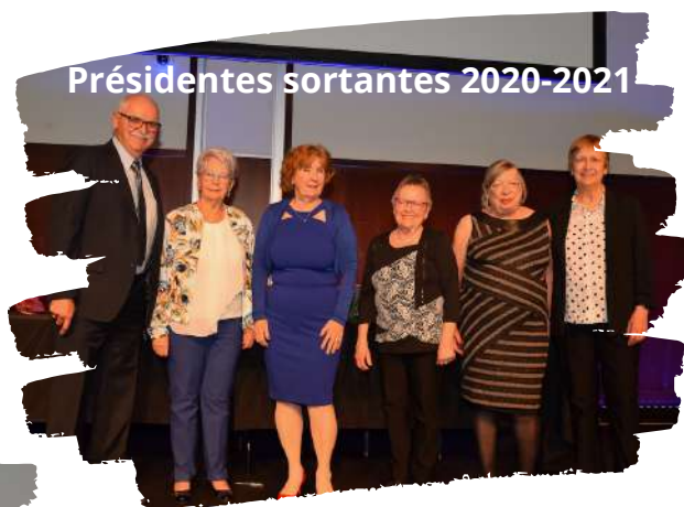
Présidentes sortantes 2020-2021