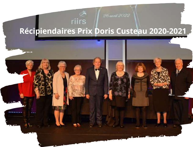
Récipiendaires Prix Doris Custeau 2020-2021