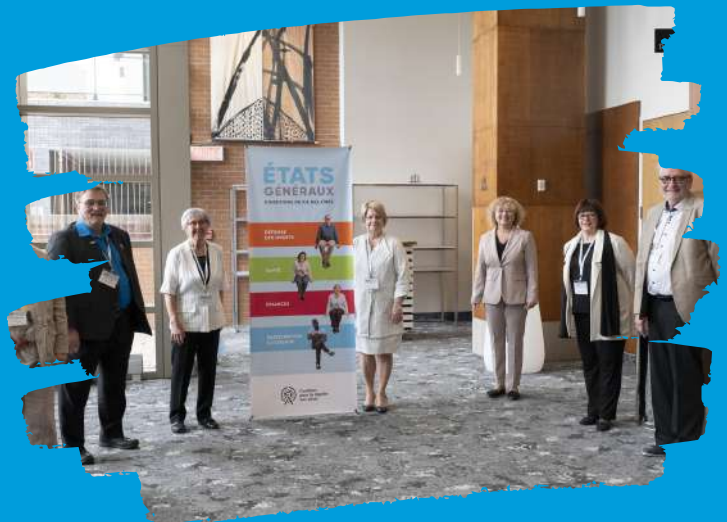
Les présidentes des associations de retraités accompagnées de la ministre Madame Marguerite Blais lors des États Généraux.