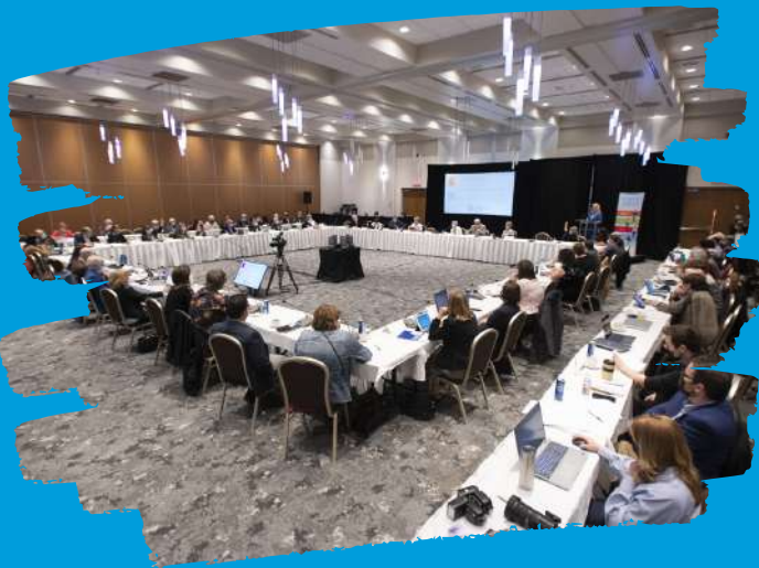
3 mai 2022 Tenue des premiers États généraux de l'histoire du Québec sur les conditions de vie des aînés.