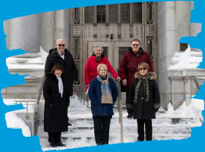
La Coalition tenait une conférence de presse à la Tribune de la presse pour annoncer officiellement les premiers États généraux sur les conditions de vie des aînés!